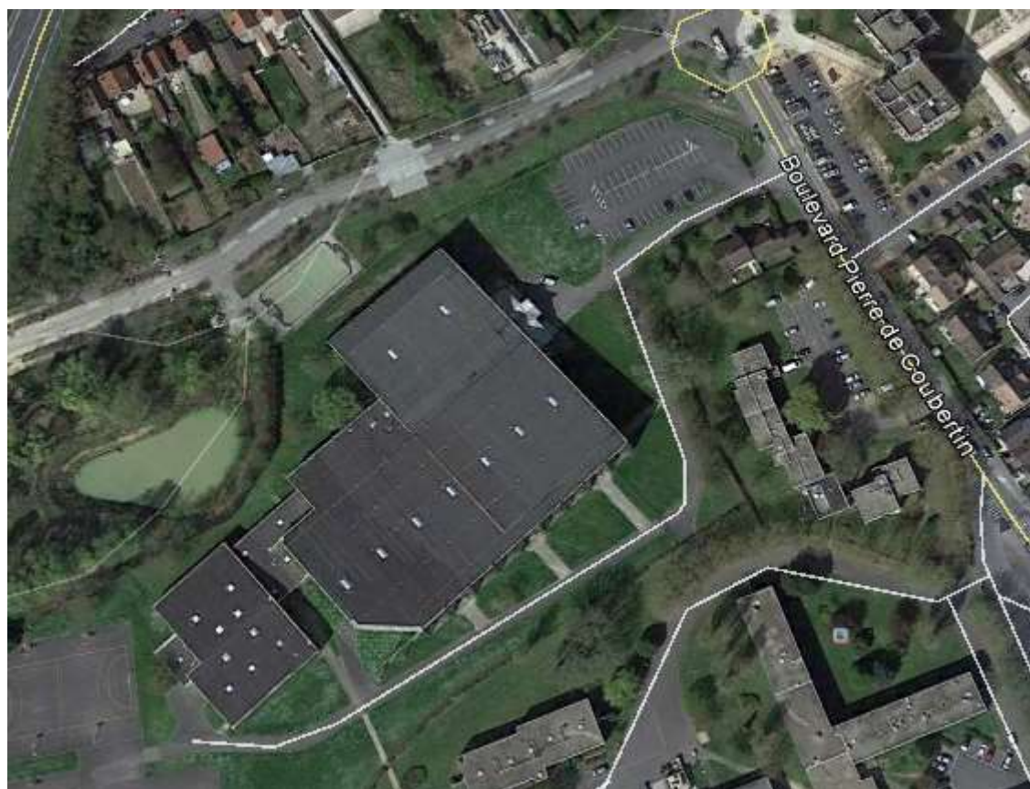
Stade couvert d'athlétisme : 5 Boulevard Pierre de Coubertin Nogent-sur-Oise